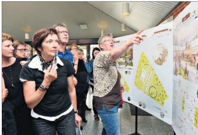
At dømme efter interessen og reaktionerne fra de ansatte på rådhuset, så er valget af projektet fra STB Byg det helt rigtige.