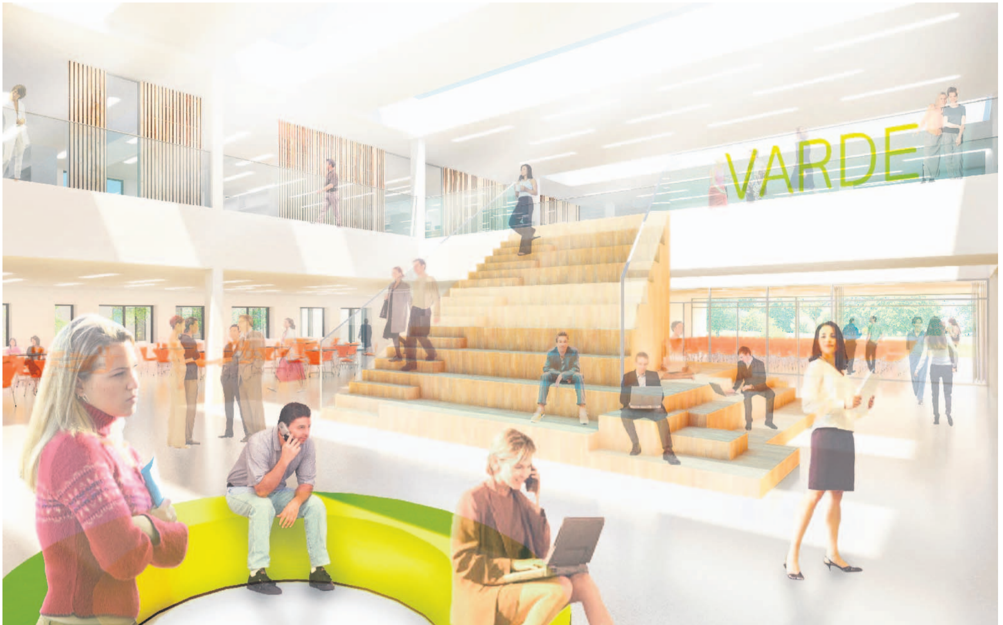
Sådan kommer den ny hall til at se ud i det nye rådhus. Bagerst ses den nye rådhusal, der kan bruges til forskellige arrangementer.